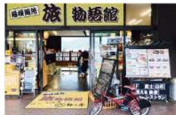
Let's Bike コミュニティサイクル http://docomo-cycle.jp/kensei

サイクルポートは芦ノ湖畔に6ヵ所。どこのポートでも自転車のレンタル、返却ができる“シェアサイクル”方式です。また、対人・対物等にも対応する各種傷害保険も付与しているので安心。交通ルールとマナーを守って、快適なサイクリングを楽しんでください。