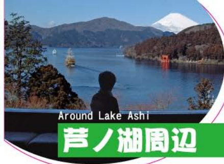
Around Lake Ashi

箱根湯本から芦ノ湖畔の箱根関所へと続く箱根旧街道。江戸時代の昔から、旅人に親しまれてきた街道名物にふれることができます。