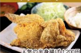
人気の半身揚げ 1,200円