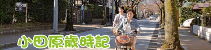
※太字は小田原城址公園内で開催される行事