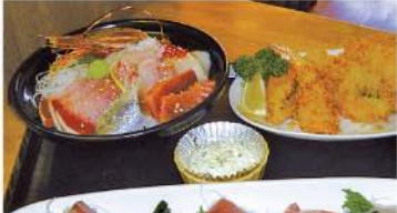
メニュー数は約50種類