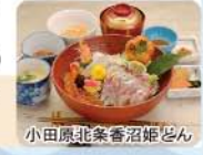
小田原北条香沼節どん