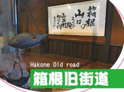
Hakone Old road