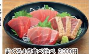
まぐろ4点食べ比べ 2,000円

まぐろ尽くしの料理を! 卸問屋の直営店。色々な種類のまぐろ料理が楽しめる! おすすめは各種丼ぶりから「まぐろ4点食べ比べ」、「カマ煮」、「まぐろユッケ」など。当日入荷した地魚の日替わりも人気!