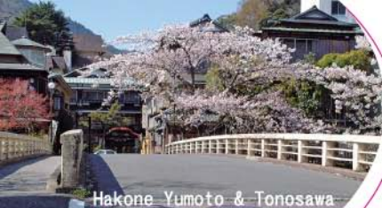
Hakone Yumoto & Tonosawa

箱根湯本は、箱根温泉発祥の地として、箱根十七湯の中でも中心的存在。早川沿いに軒を連ねる塔ノ沢温泉とともに温泉情緒あふれるエリアです。