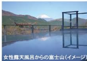
女性露天風呂からの富士山(イメージ)