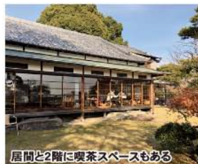
居間と2階に喫茶スペースもある