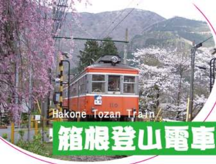
Hakone Tozan Train