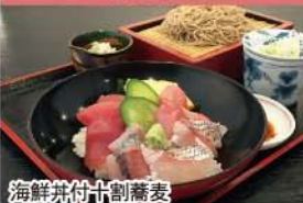
海鮮丼付十割蕎麦