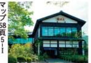
箱根海賊船の箱根町港 の前…店舗紹介49頁