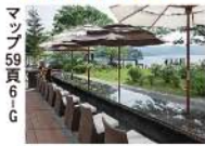
Bakery & Table 箱根 …元箱根