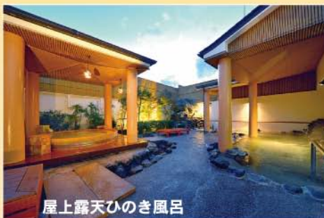
屋上露天ひのき風呂