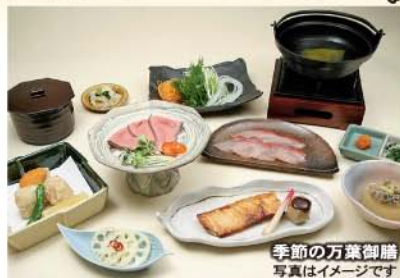
季節の万葉御膳 写真はイメージです