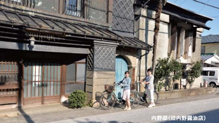
内野邸(旧内野醤油店)