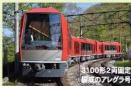
3100形2両固定編成のアレグラ号

箱根登山電車のアレグラ号は車両全面に大型ガラス、側面には上下に大きく広がる展望窓があり、箱根の雄大な自然が体感できます。