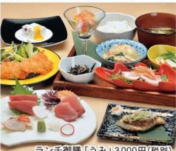
ランチ御膳「うみ」3,000円(税別)

小田原港より届く地魚と旬の食材を織りまぜて、都内で修行した板前さんが腕をふるう「創作割烹」が味わえます。料理は水産会社の直営店ならではのお手頃価格なので、ランチのコースは2,200円より。お得な定食セットは、揚げ物、煮物、煮魚、刺身の5種類が付いておすすめです。