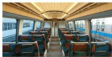
左右に流れ行く景色を堪能…車両側面の連続窓