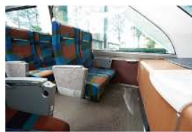
ダイナミックな眺望…展望席