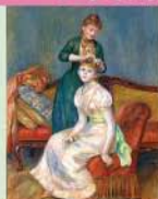
ピエール・オーギュスト・ルノワール「妻がざり」

日本有数の印象派コレクション モネ、ルノワールなど印象派のコレクションを中心に、西洋絵画、日本の洋画、日本画から東洋陶磁、ガラス工芸、化粧道具など常時約300点を展示。