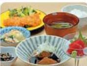
いろいろおかず5種定食

小田原港より届く地魚と旬の食材を織りまぜて、都内で修行した板前さんが腕をふるう「創作割烹」が味わえます。料理は水産会社の直営店ならではのお手頃価格なので、ランチのコースは2,200円より。お得な定食セットは、揚げ物、煮物、煮魚、刺身の5種類が付いておすすめです。