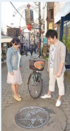
小田原のマンホール