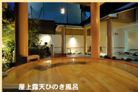
屋上露天ひのき風呂