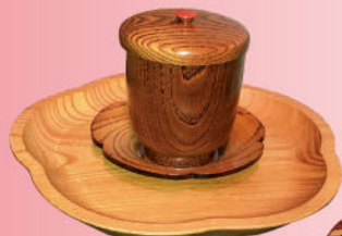
箱根寄木細工 りんごの器 …金指ウッドクラフト