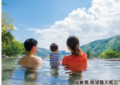
超絶景 展望露天風呂

セグウェイに乗車するには、満16歳から概ね70歳まで、普通自動車運転免許、または普通自動二輪免許が必要。期間2020年4月4日～11月30日、事前予約制。☎セグウェイジャパン(株) TEL.080-3434-8360(セグウェイツアー事務局)