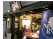
エヴァンゲリオン公式ストア「箱根湯本えうあ屋」…箱根湯本駅1F

箱根の芸者衆のお稽古場でもある湯本見番。ここでは5月1日・2日の「ゴールデンウィークイベント」をはじめ、箱根をどりや芸者's Barなどのイベントが開催されます。詳細は箱根湯本芸能組合HP http://www.geisha.co.jp/