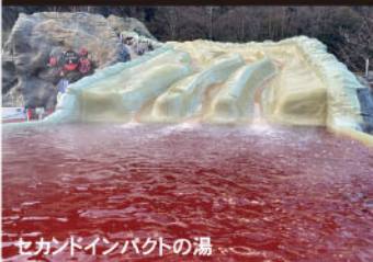
セカンドインパクトの湯