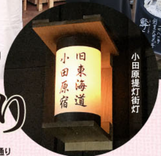
さくら新酒めぐり 前年度の模様

毎月第1・3週の土日に開催。 毎回、小田原かまぼこ12社のうち6社分食べ比べ。 1回6社セット500円。会場 小田原宿なりわい交流館 (観光案内・お休み処) ☎0465-20-0515